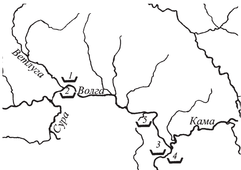
Рис. 2. Карта раннеананьинских памятников, материалы которых исследованы металлографически: 1 — Старший Ахмыловский могильник, 2 — Акозинский могильник, 3 — Тетюшский могильник, 4 — II Полянский могильник, 5 — Пустоморквашинский могильник

Для решения поставленных задач мы привлекаем данные металлографического исследования железных предметов из ряда памятников ананьинской культуры. Перспективность работы в этом направлении уже была апробирована при анализе неболь-